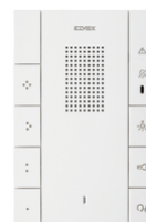
40547 - Citofono vivavoce 2F+ Voxie 7 puls. b.co