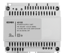
40100 - Aliment. Kit Cito m/b 2F+ 100-240V 0,6A