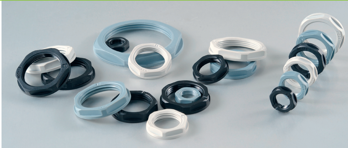
DP - Controdadi in Poliammide

COLOURS DP = grey RAL 7001 DPG = grey RAL 7035 DPN = black RAL 9011